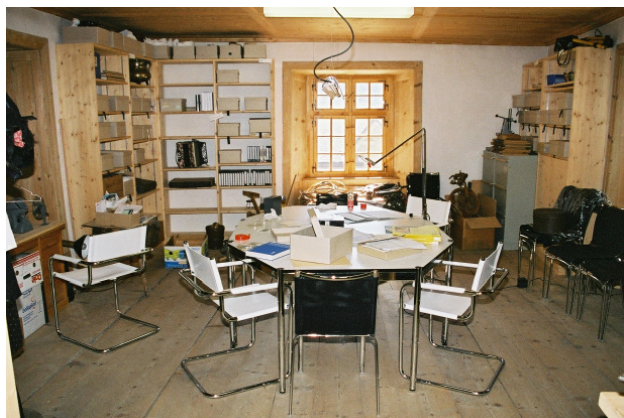
Archiv MRS mit Dokumentation auf dem Arbeitstisch.